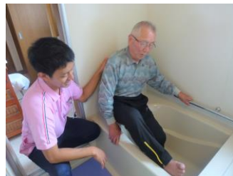
訪問リハビリテーション