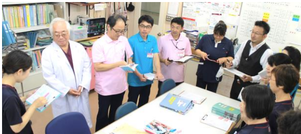
毎朝のミーティング（退院支援）