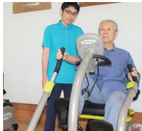
リハビリテーション