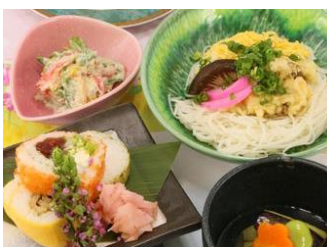
栄養面の工夫（行事食）