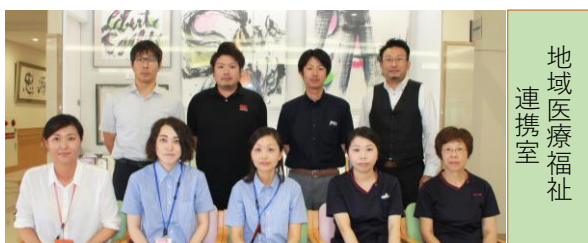
（恵寿病院・恵愛荘・恵仁荘）